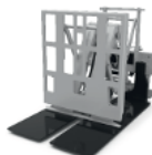
Push / Pull