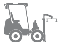
Сочлененные вилочные погрузчики