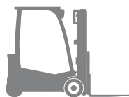
Электрические вилочные погрузчики