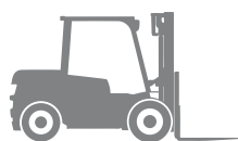
Дизельные вилочные погрузчики